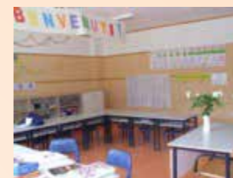
Nelle foto: aula, aula informatica e la palestra